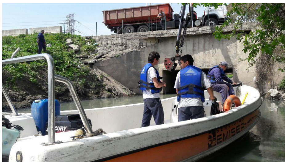
Tracker motor 90 HP