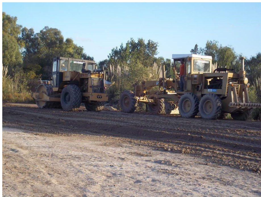
Compactador y motoniveladora en camino alternativo Nordelta