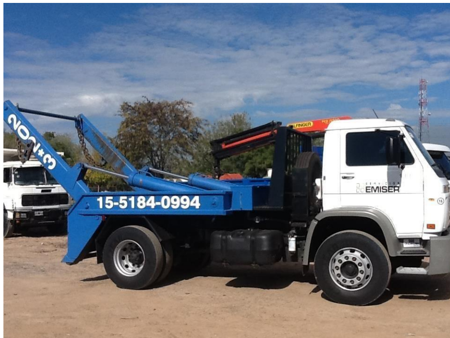
Camión Volkswagen 13-180 con equipo porta volquete modelo 2012