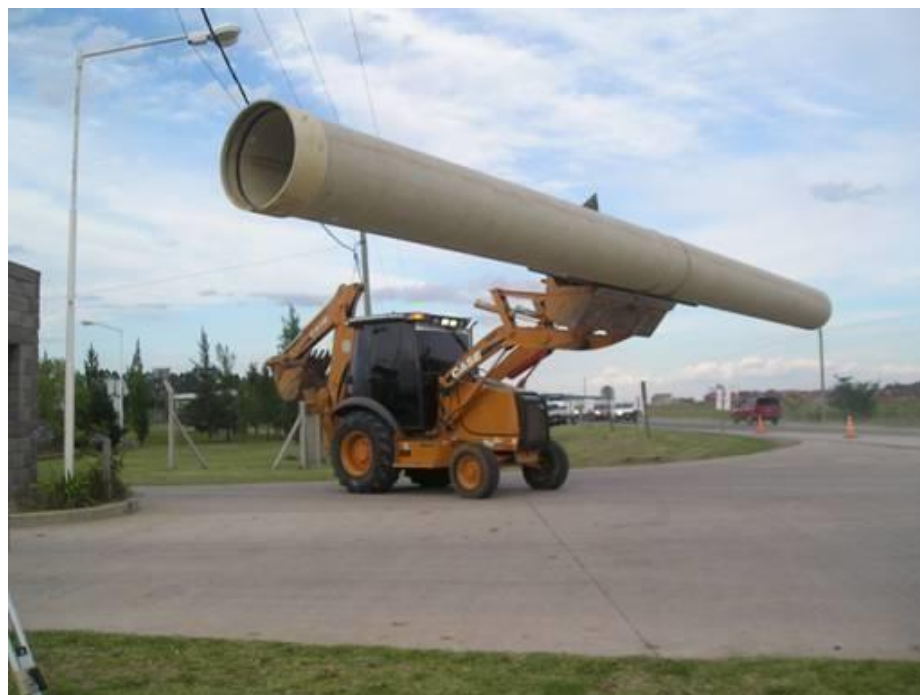
Pala-Retro 580 – tendido cañería PRFV Parque tecnológico Industrial Zarate