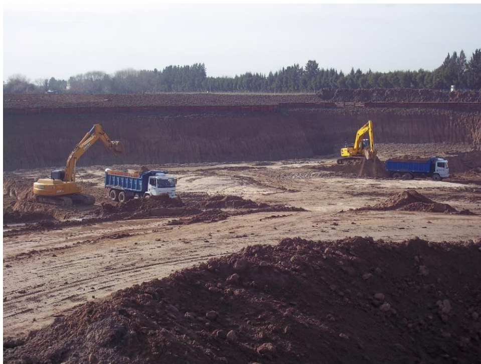
Movimiento suelo – Ciudad Pueblo Nordelta – Barrio Los Tilos