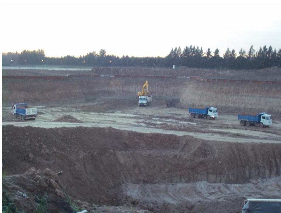
Movimiento suelo – Ciudad Pueblo Nordelta – Barrio Los Tilos