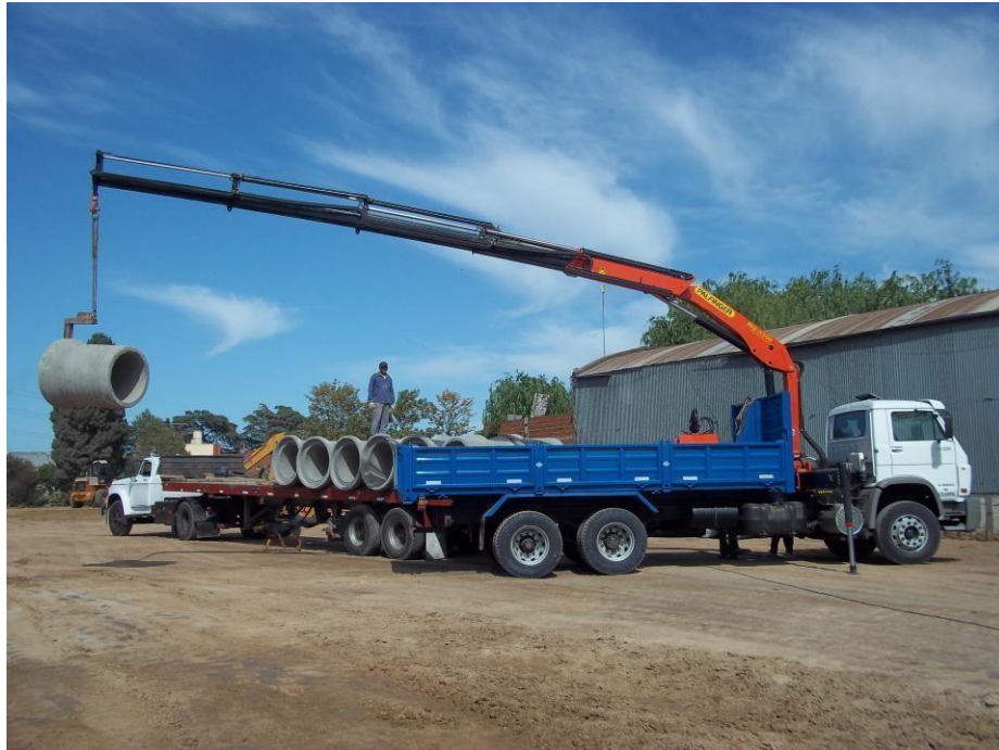
Camión Volkswagen 17-220 balancín con hidrogrúa 15tm