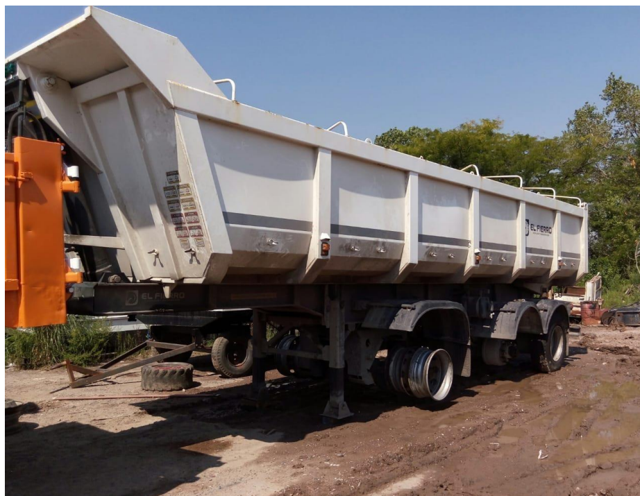
Batea El Fierro