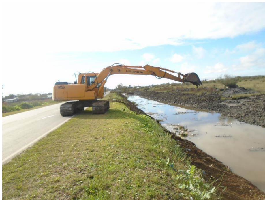
Retro excavadora HYUNDAI ROBEX 140 LC7.