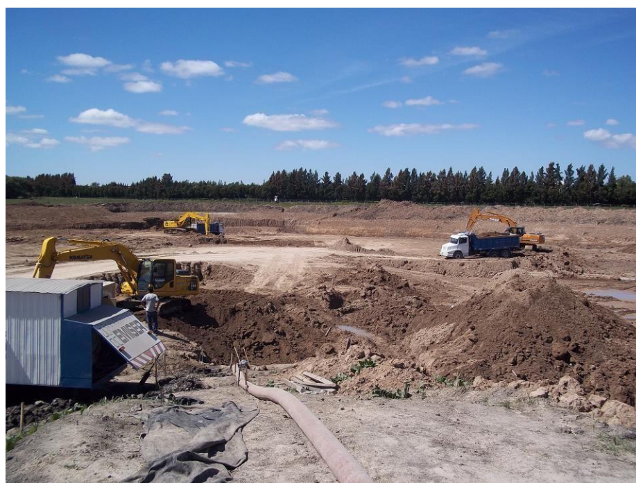
Cantera barrio Los Tilos prox. Laguna – Nordelta-