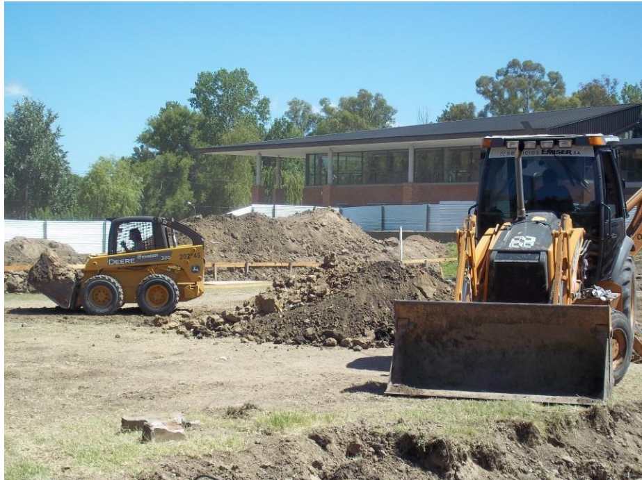
Minicargadora John Deere 320