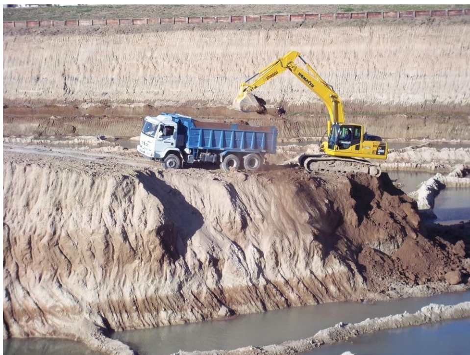
Movimiento suelo – Ciudad Pueblo Nordelta – Barrio Los Tilos