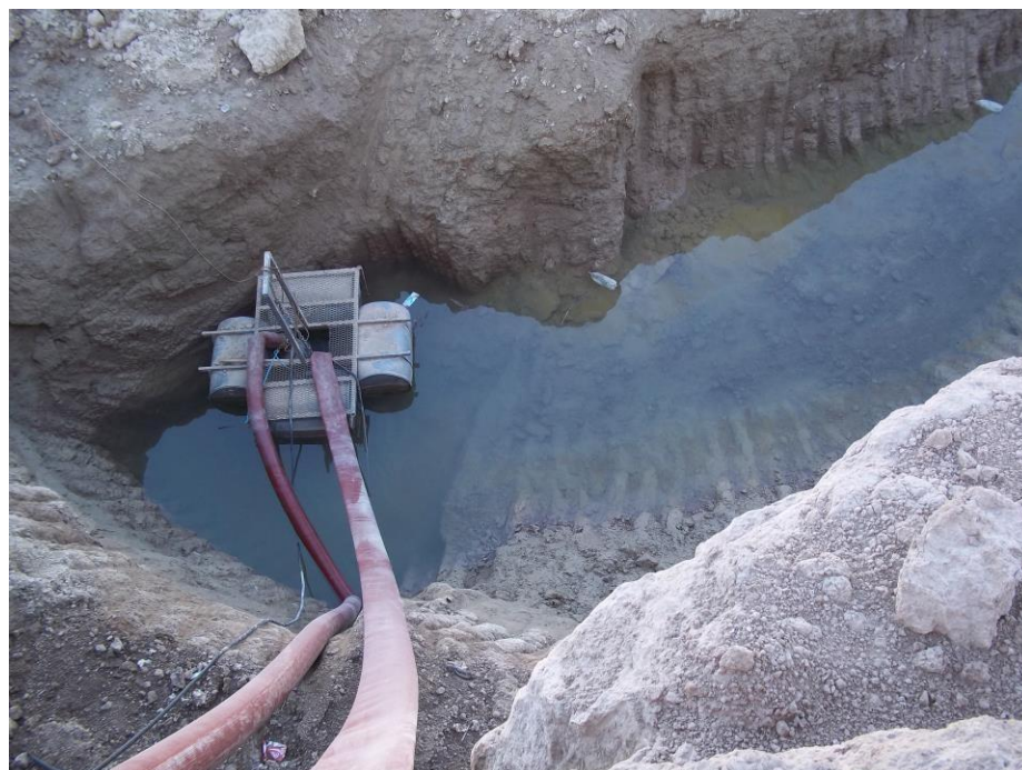
Bomba sumergible Flygt trifásica con salida de 6" 50lt x segundo