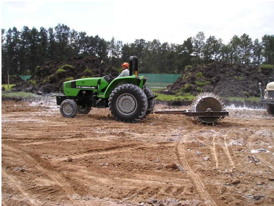
Tractor Agco Allis 675