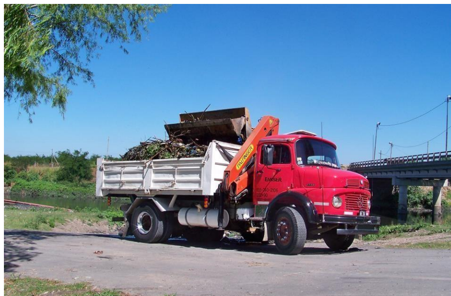
Camión volcador Mercedes Benz 1114 con Hidrogrúa