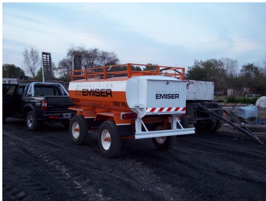
Tanque para combustible