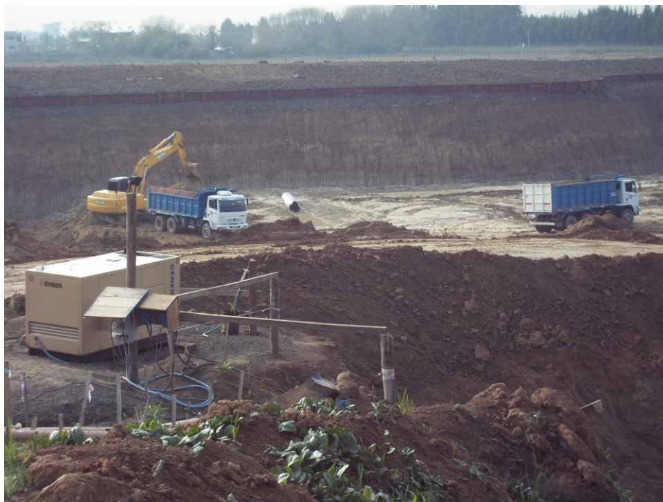
Movimiento suelo – Ciudad Pueblo Nordelta – Barrio Los Tilos