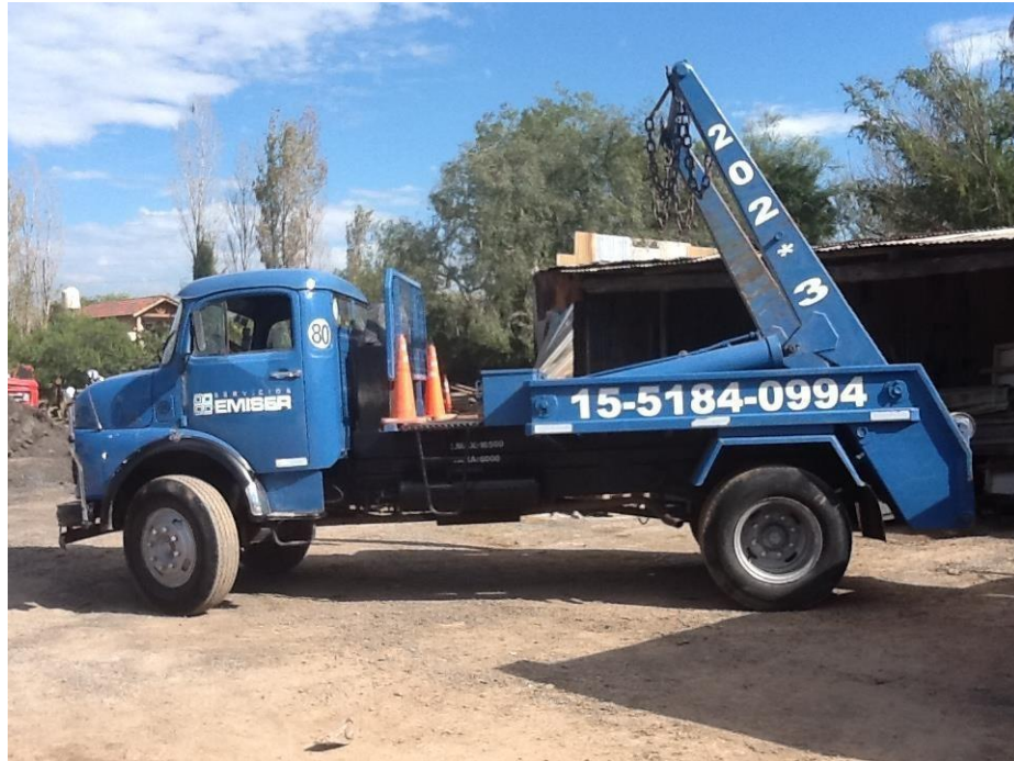
Camión Mercedes Benz con equipo porta volquetes