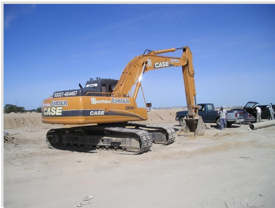
Retroexcavadora CASE CX 210