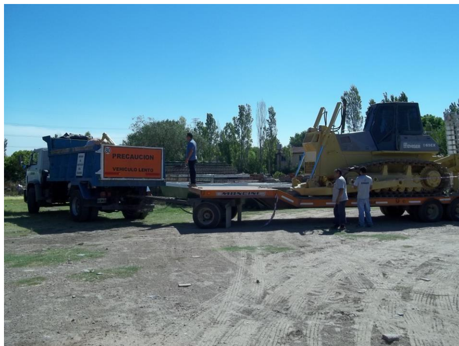
Carretón Manchini 25 Tn