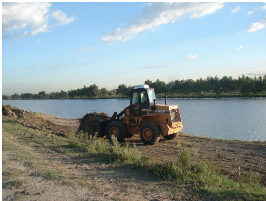
Pala cargadora Case W20E – Limpieza pista nacional de remo