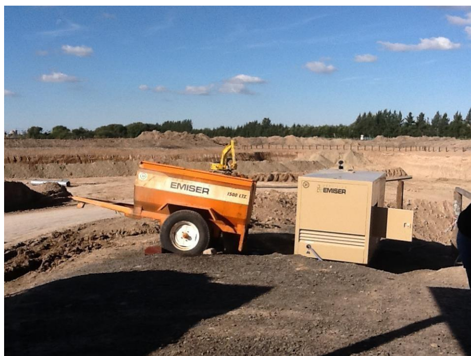
Grupo electrógeno 120 KVA