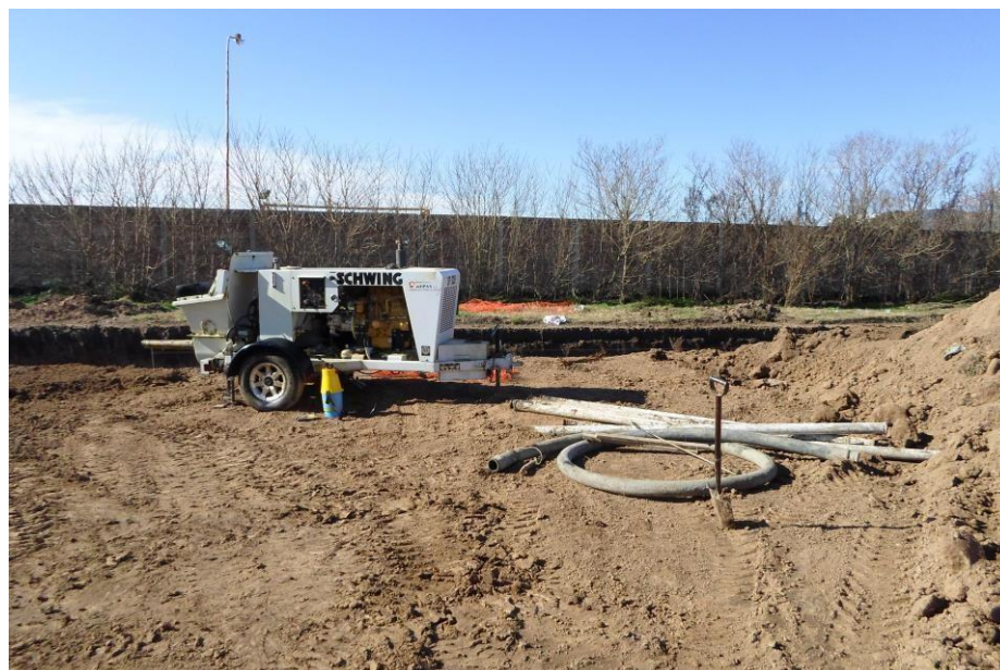
Bomba de Hormigón Schwing SP305