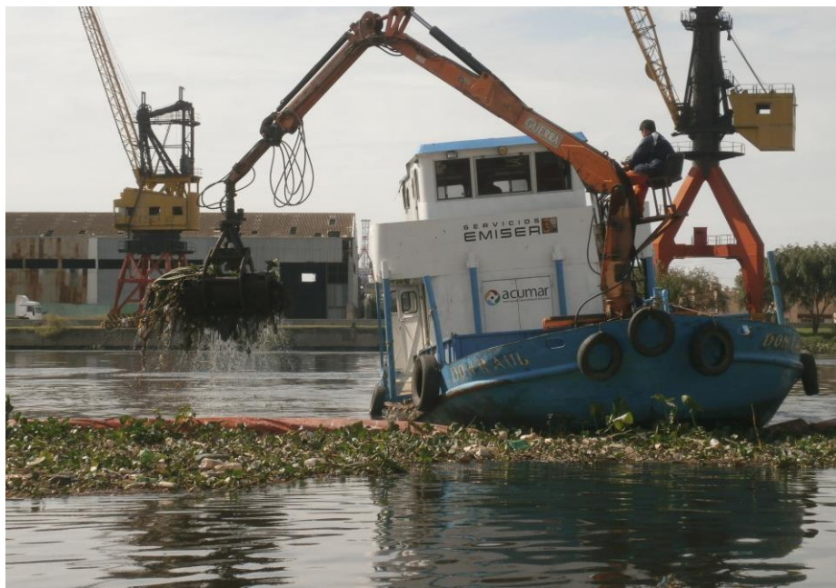
Barco DON RAUL con hidrogrúa y balde almeja