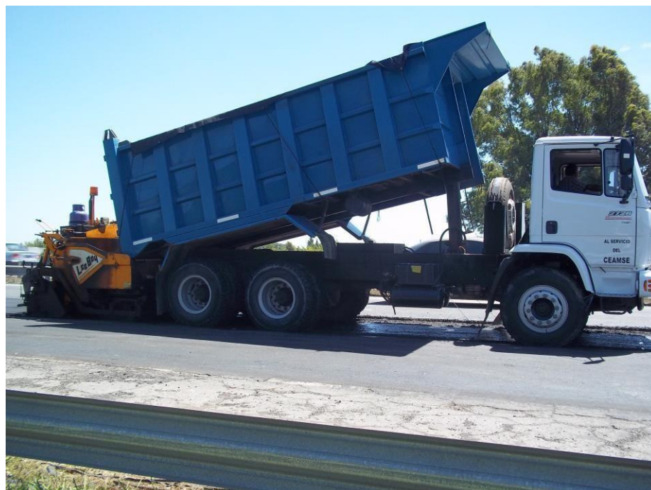
Camión Mercedes Benz 2726 k Frontal Tatu