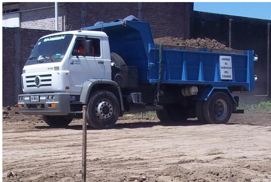
Camión volcador Volkswagen 13-180 modelo 2010