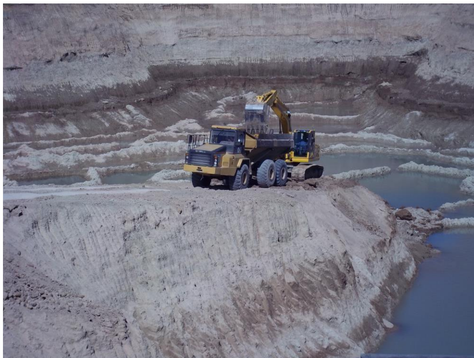
Movimiento suelo – Ciudad Pueblo Nordelta – Barrio Los Tilos