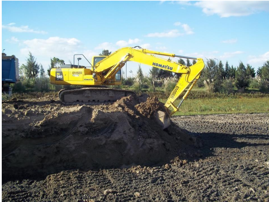
Retro excavadora Komatsu PC 240.