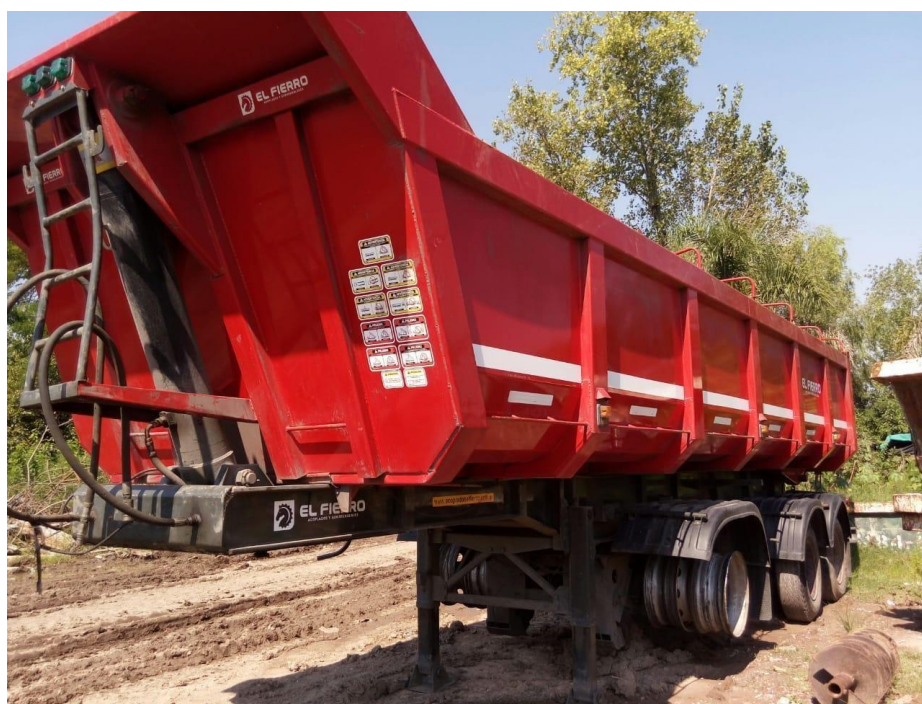
Batea El Fierro