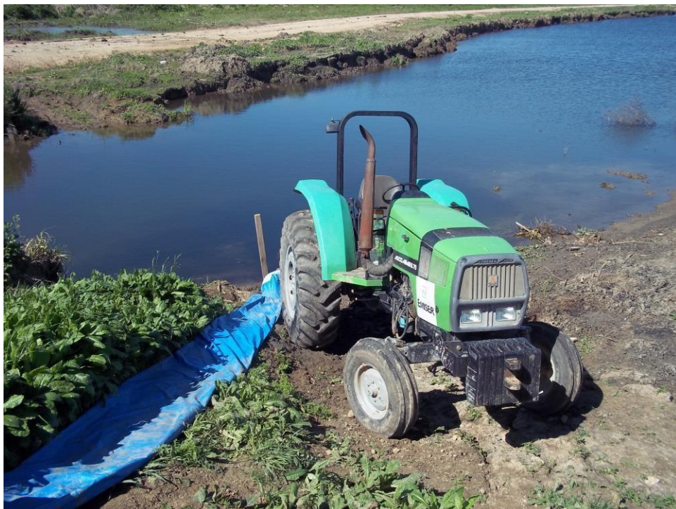
Ensanche Canal Las Tunas – Ciudad Pueblo Nordelta