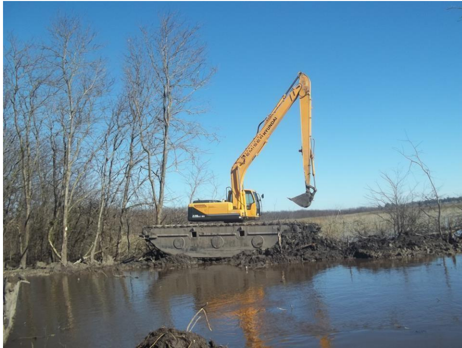
Retro excavadora ANFIBIA HYUNDAI 220 – LC - 95.