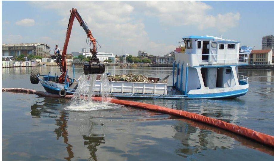
Barco DON RAUL con hidrogrúa y balde almeja