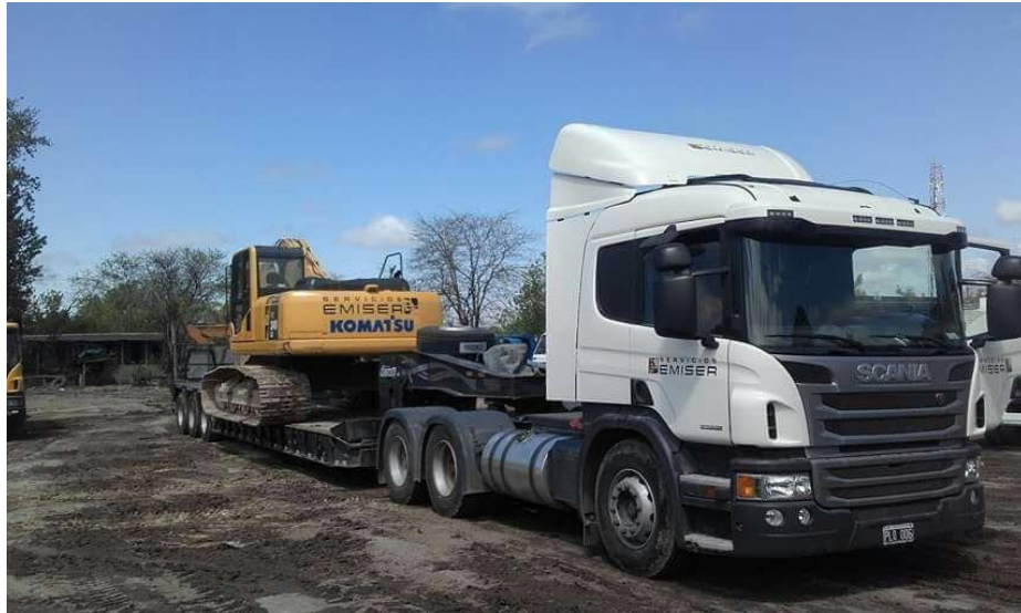
Camión Scania P 360 6x4 Tractor