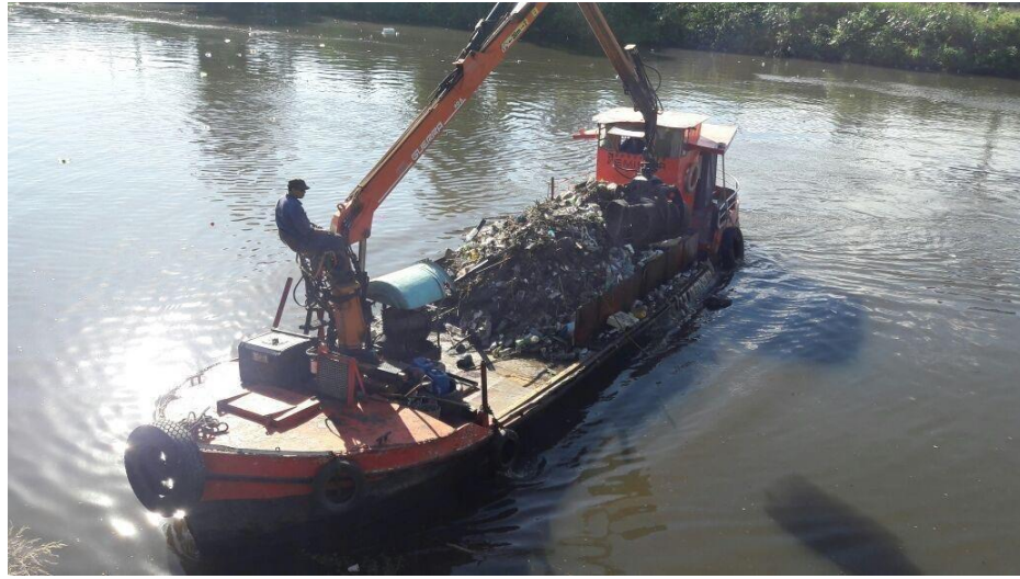
Barco PLAYERA III con hidrogrúa y balde almeja