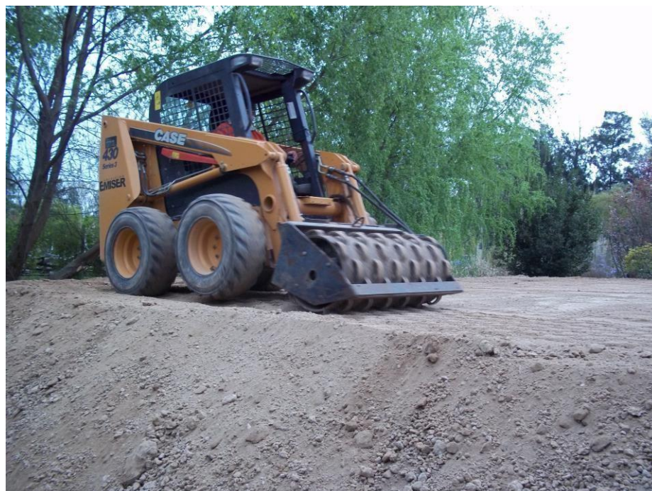
Minicargadora Case 430 con Rolo