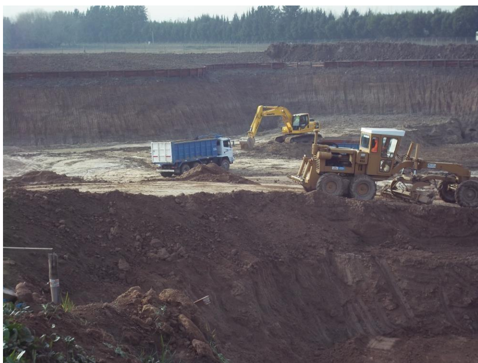
Movimiento suelo – Ciudad Pueblo Nordelta – Barrio Los Tilos