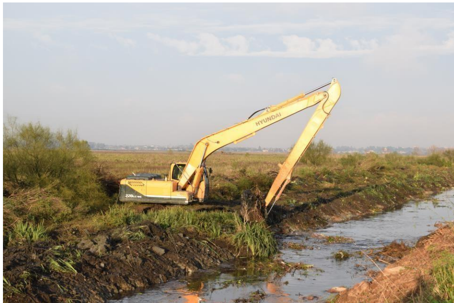
Retro excavadora HYUNDAI ROBEX 220 LC 9S.