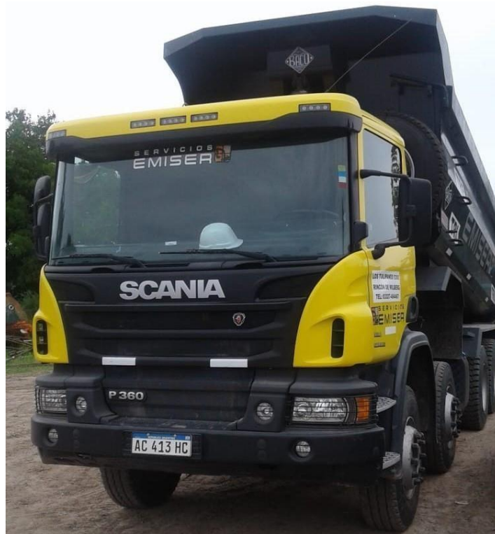
Camiones Scania 310 8x4 Frontal Tatu