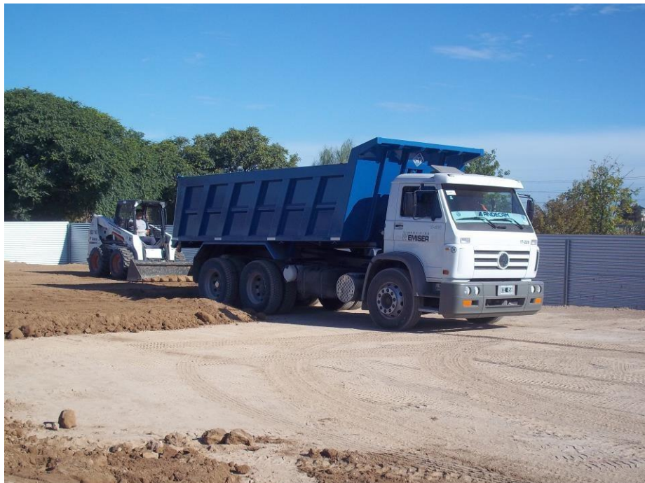
Camión volcador Volkswagen 17-220 balancín