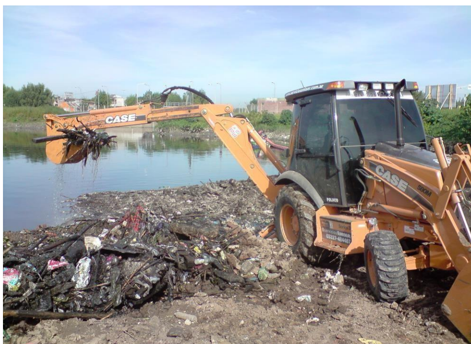
Extracción de sólidos residuos flotantes del Río Reconquista