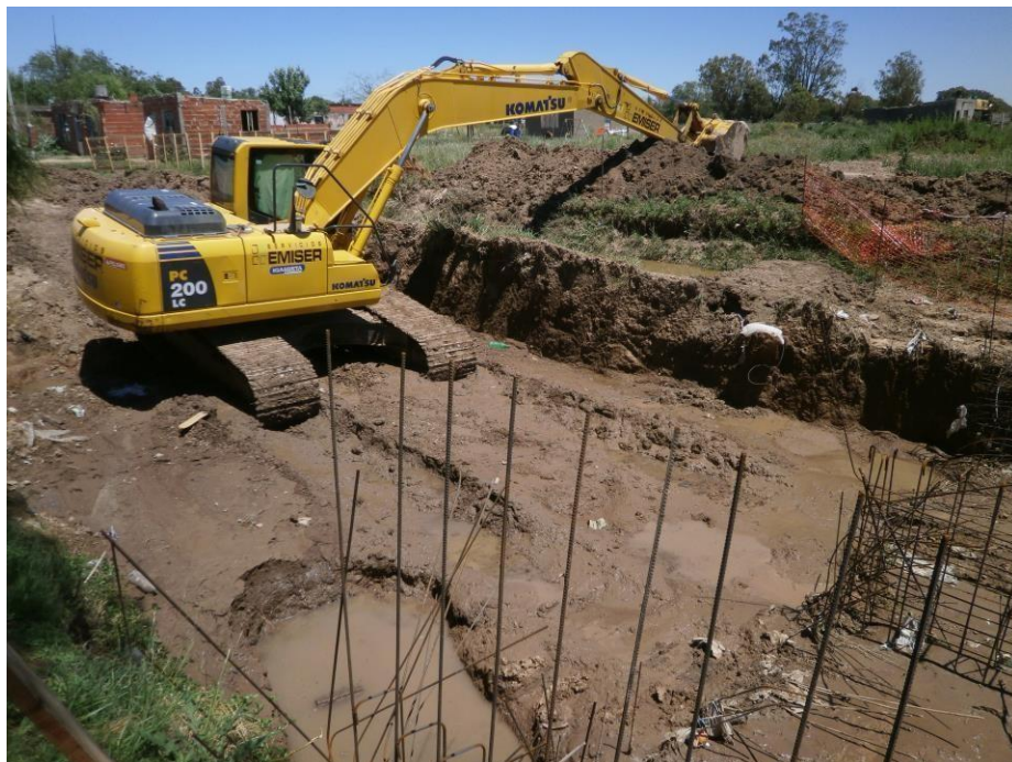
Retro excavadora Komatsu PC 200.