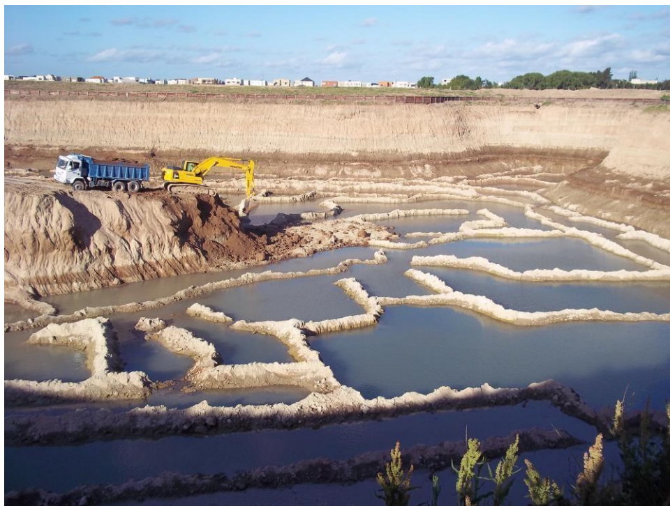
Movimiento suelo – Ciudad Pueblo Nordelta – Barrio Los Tilos