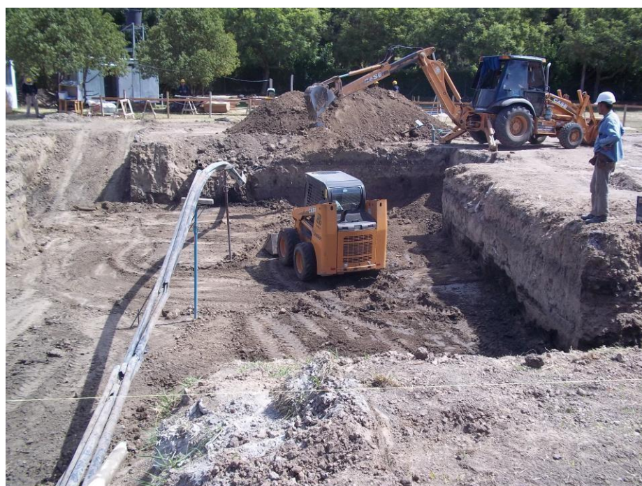
Minicargadora case 420