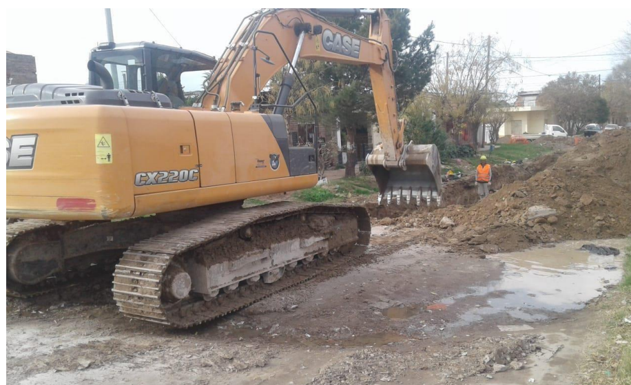
Retroexcavadora CASE CX 220C