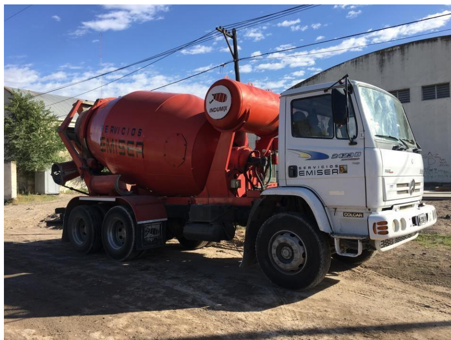
Camión mixer Mercedes Benz 177 – 2423 B