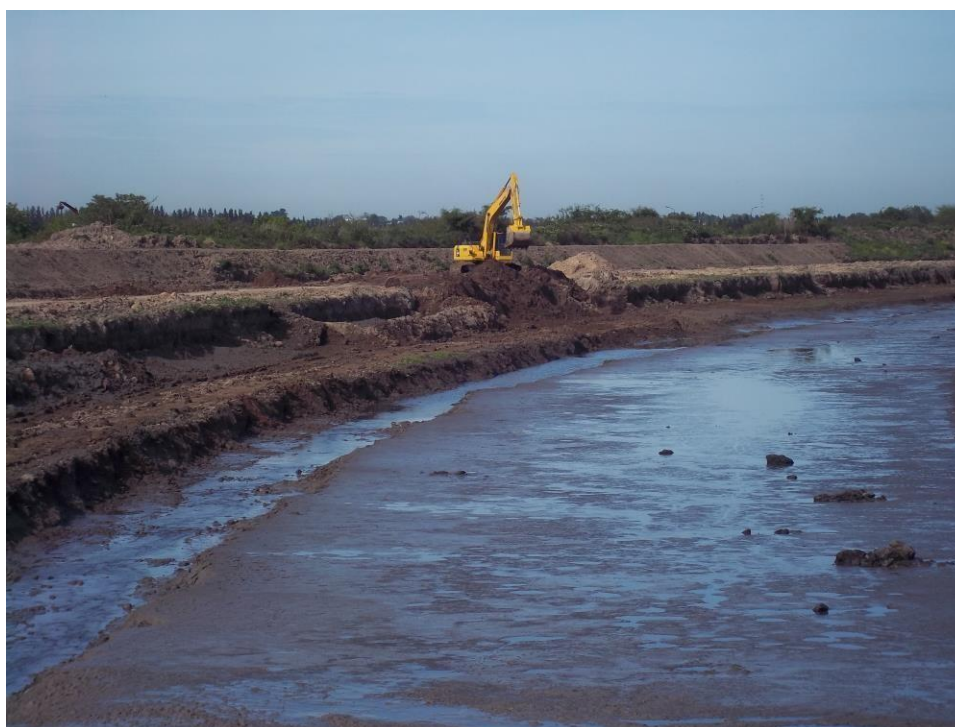
Ensanche Canal Las Tunas – Ciudad Pueblo Nordelta