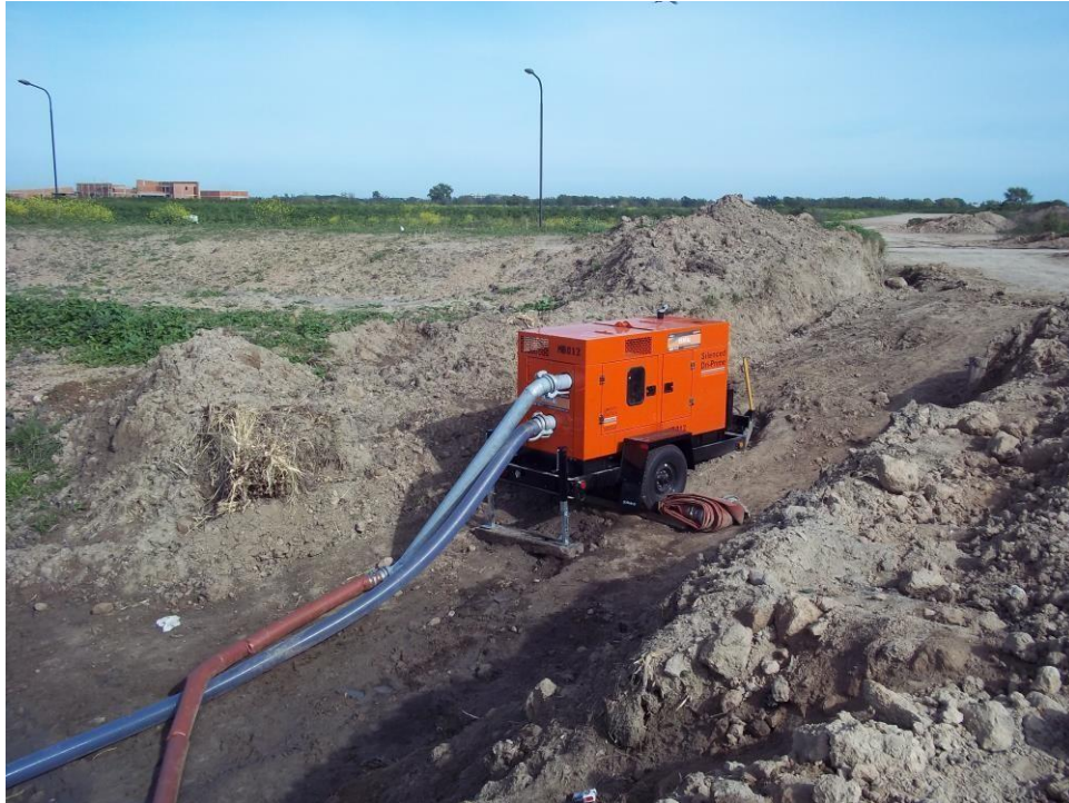
Ensanche Canal Las Tunas – Ciudad Pueblo Nordelta