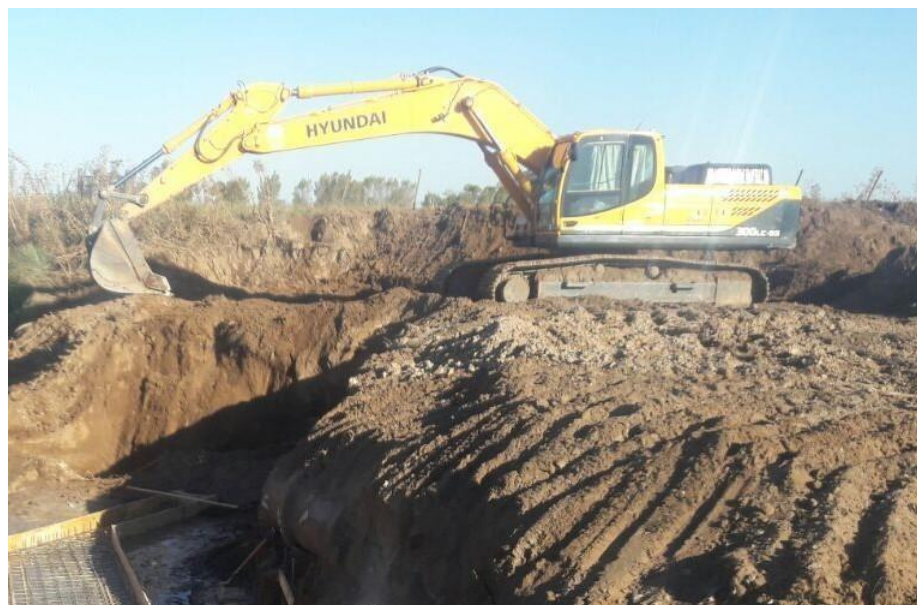
Retro excavadora HYUNDAI ROBEX 300 9S.