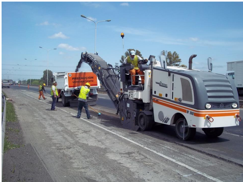
Fresadora Wirtgen W100 2011