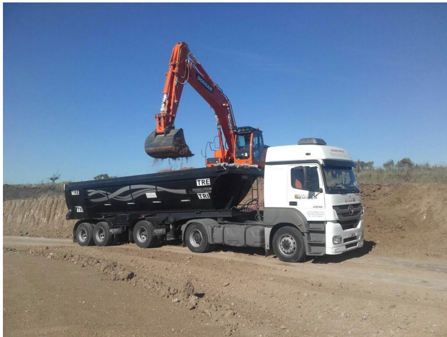
Camión Mercedes Benz Axor 2040S/36 Tractor