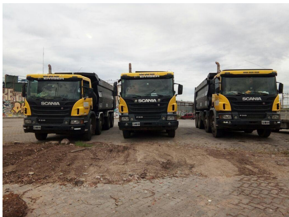
Camiones Scania 310 8x4 Frontal Tatu