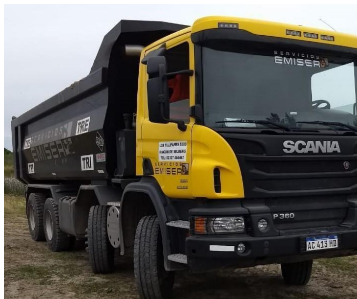
Camión Scania 310 8x4 Frontal Tatu