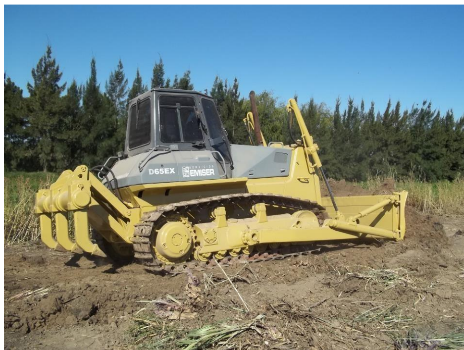
Topador Komatsu D65EX