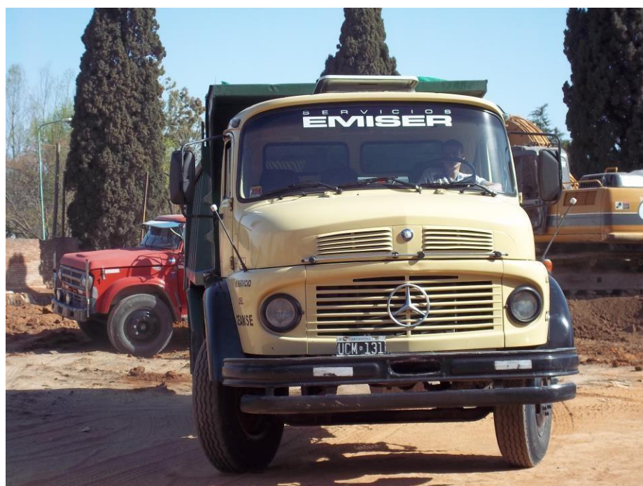
Camión volcador Mercedes Benz 1114