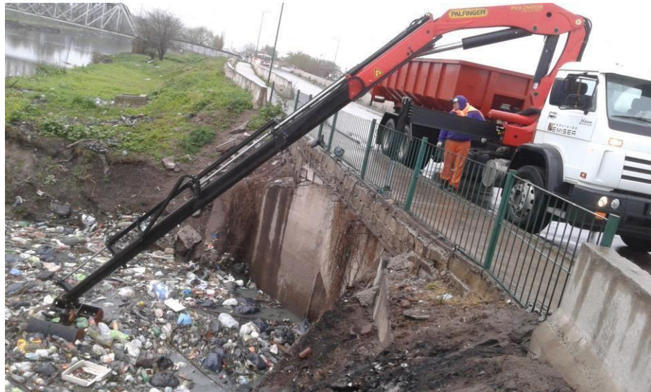
Camión Volkswagen 17-220 con equipo roll-off e hidrogrúa 26 tm.