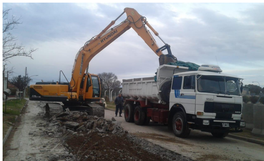
Retro excavadora HYUNDAI ROBEX 220 9S.