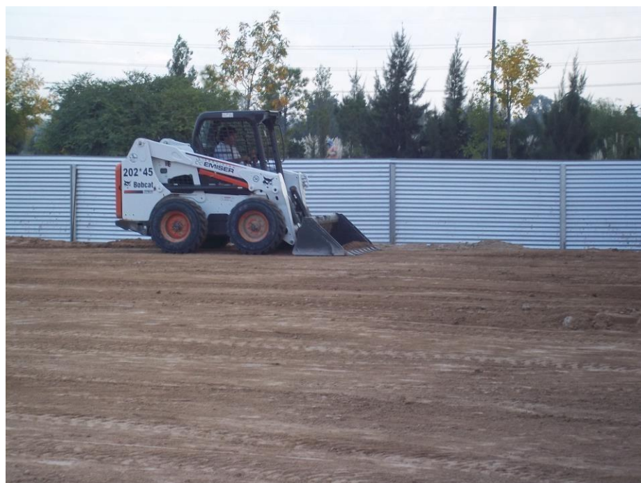
Minicargadora Bobcat S630 2012