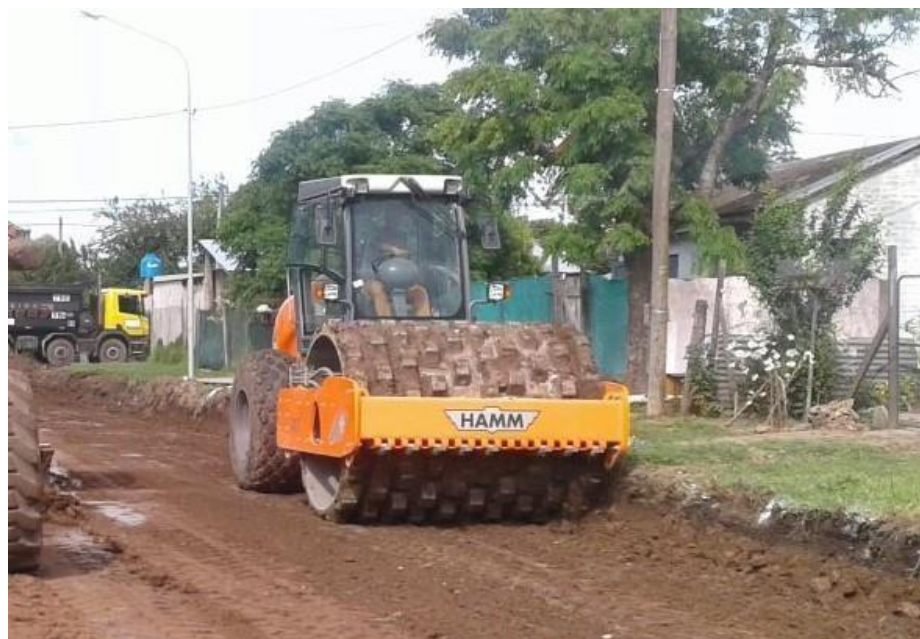
Compactador Hamm 3411