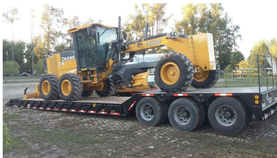
Motoniveladora John Deere 770G