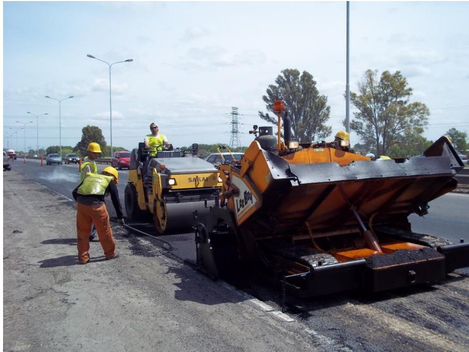
Terminadora de asfalto Leeboy 2011 – Rolo liso combinado Sakai 2011