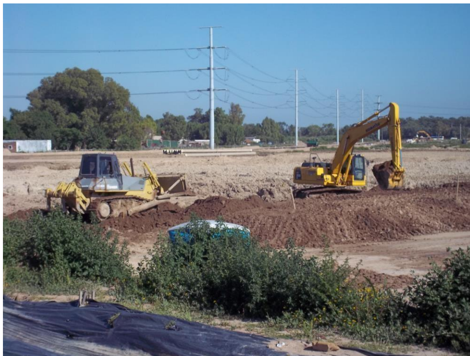
Movimiento suelo – Ciudad Pueblo Nordelta – Barrio Los Tilos