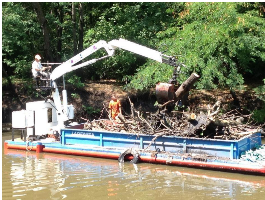
Barco tipo Chata autopulsado con hidrogrúa y balde almeja